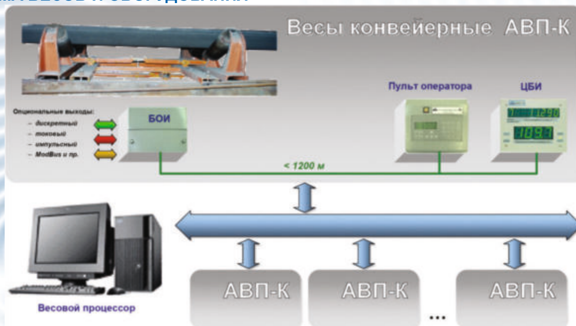
СХЕМА ВЕСОВ И ОБОРУДОВАНИЯ

Комплект калиброванных роликкоопор и роликов для весов и весовой зоны